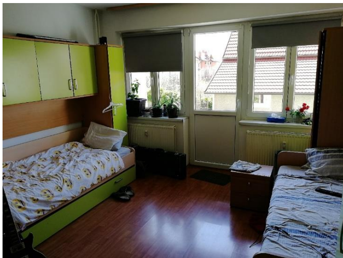
Na fotografiji je Martinova soba, ki si jo deli z enim stanovalcem.