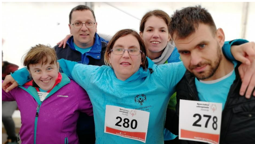
Manca skupaj s sodelavci na tekmovanju na Vrhniki.