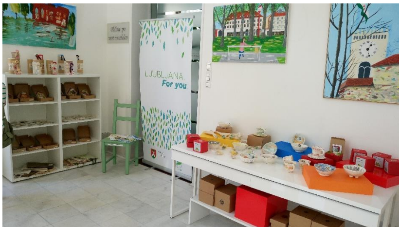
Skrbovin`ca v letu 2017.