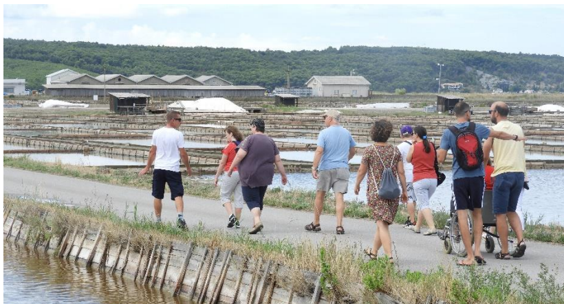
Sprehod po Sečoveljskih solinah.