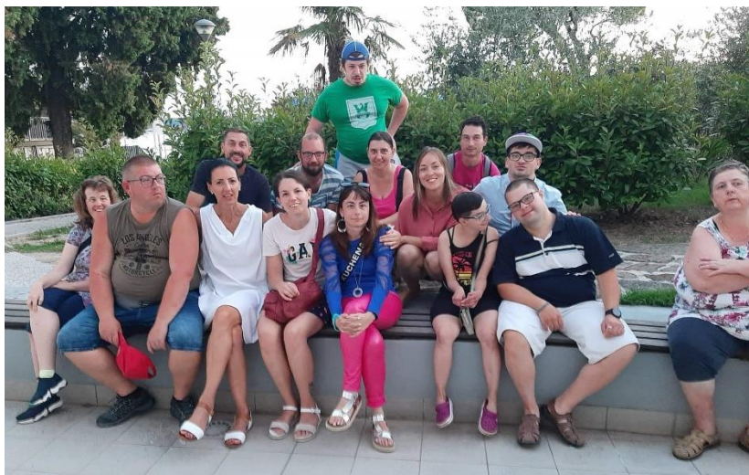
Večerni odhodi v mesto.