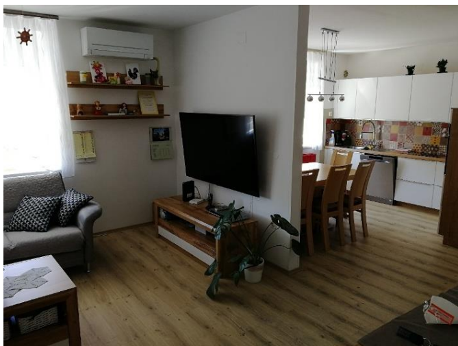
Na fotografiji je dnevna soba in kuhinja bivalne enote v Postojni.